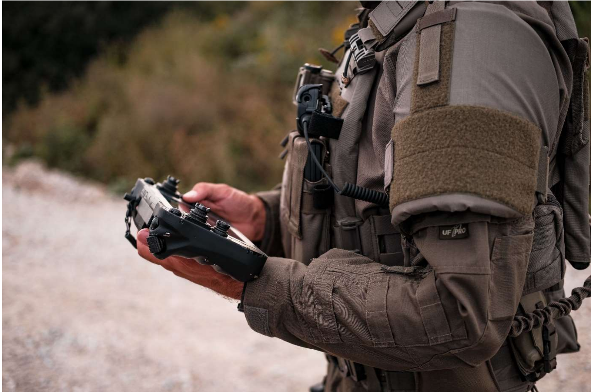
Bild 1: Vector verfügt über eine entsprechende digitale Anbindung, um in Kombination mit anderen Systemen in Echtzeit zu kommunizieren und somit eine Kampfwertsteigerung im Verbund zu erreichen.